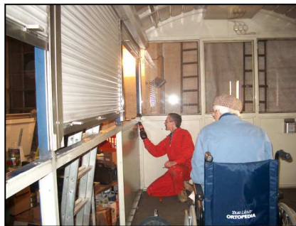
Neue Abdichtung der Seitenwände und weitere Verbesserungen im Zuge des Umbaus

setzt hat sich die Variante mit den standardisierten und auf vielen Bahnhöfen der Schweiz eingesetzten Hebeliftwagen. Sie erlauben