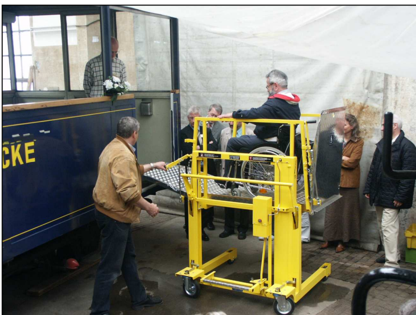
Mit den Hebeliften der SBB können Behinderte auf Rollstühlen bequem und gefahrlos zusteigen

Diese Umrüstung ermöglicht vielen Personen ein Erlebnis auf der Dampfbahn Furka-Bergstrecke, das ihnen sonst verschlossen wäre. Das Echo war entsprechend positiv.