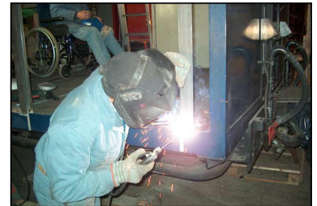
Arbeit an der Einstiegsöffnung

heraus gequollenen Dichtstreifen der Seitenwandplatten wurden entfernt, die Platten gereinigt und mit Silikon abgedichtet. Die Holzfenstersimse wurden neu lackiert und die Wandfarbe an vielen Stellen